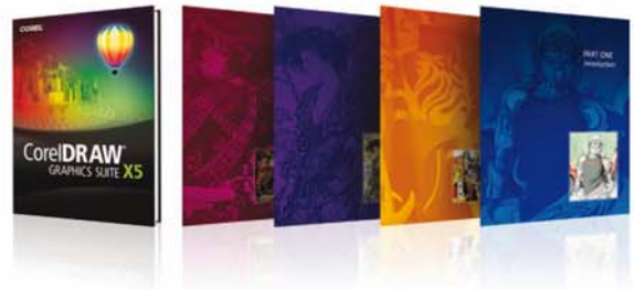
Die Box-Version der CorelDRAW Graphics Suite X5 wird mit einem gebundenen, vielfarbigem Handbuch ausgeliefert.

Nutzen Sie die neueste Windows®-Umgebung – Unter Windows® 7 können Sie CorelDRAW auf Touchscreen-Monitoren nun auch per Fingerzeig bedienen. Die neueste Version wurde für Windows 7 optimiert und unterstützt auch Windows Vista® und Windows® XP.