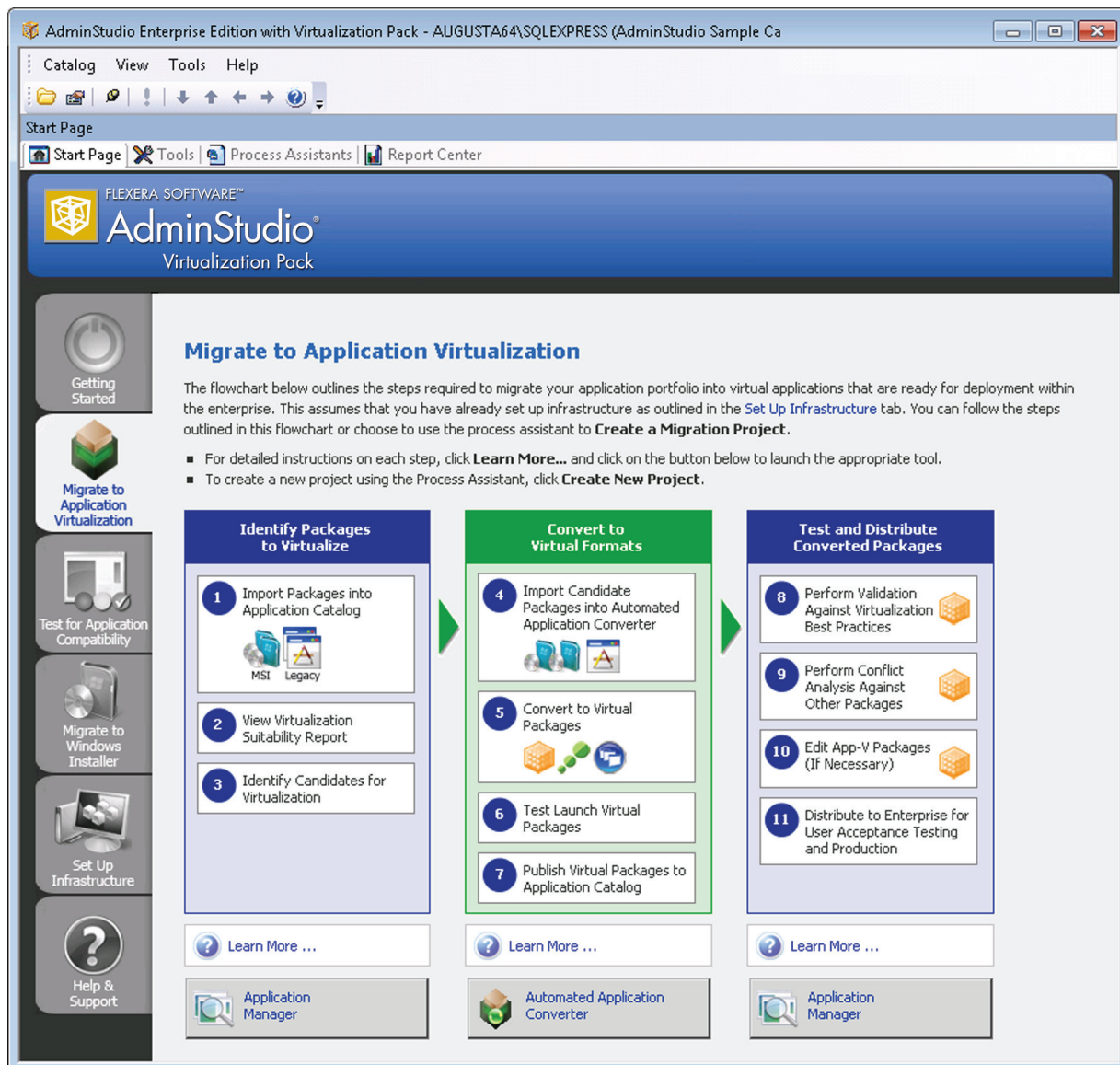
Abbildung 1.3: Workflow der AdminStudio-Anwendungsvirtualisierung

AdminStudio Virtualization Pack erstellt zuverlässige virtuelle Anwendungen für die Bereitstellung, bestehend aus einem vollständigen Set an Funktionen im Bereich Eignungstests, automatische Umwandlung, Validierung, Bearbeitung und Verwaltungsberichterstellung. Die Umwandlung von MSI- und älteren Installern in virtuelle Anwendungsformate wird automatisiert, wodurch ein konsistenter Ansatz sichergestellt werden kann, der bis zu neunmal schneller ist als bei der Verwendung nativer Tools und die Kosten und die Dauer eines Migrationsprojektes reduziert.