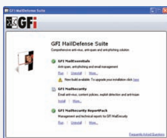
Gemeinsame, zentrale Verwaltungskontrolle

GFI MailSecurity setzt zur Überprüfung eingehender E-Mails mehrere Viren-Scanner ein. Die Verwendung verschiedener Engines verkürzt die durchschnittliche Wartezeit bis zum Erhalt aktualisierter Signatur-Updates und verringert die Gefahr, mit einem neuen Virus infiziert zu werden. Es gibt keinen Antiviren-Hersteller, der stets am schnellsten auf akute Bedrohungen reagiert. Wird ein neuer Virus bekannt, hängt ein rasches Bereitstellen entsprechender Updates z. B. davon ab, wo der Schädling entdeckt wurde. Die Verwendung mehrerer Scan-Engines erhöht die Chance, dass mindestens eine von ihnen zeitnah aktualisiert wird und rechtzeitig Schutz bietet. Zudem wendet jede Lösung ihre eigene Heuristik an und besitzt individuelle Abwehrmethoden. Einige Scanner erkennen bestimmte Virenarten samt Untergruppen besser als andere, die wiederum ihre eigenen speziellen Stärken haben. Fakt ist: Je mehr Scan-Engines eingesetzt werden, desto umfassender ist der Schutz.