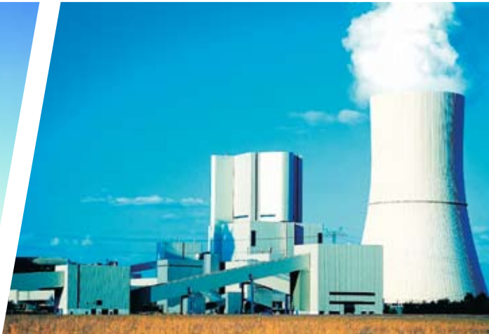
Die Vattenfall Europa AG verfügt über modernste Anlagen – Software spielt für den täglichen Betrieb eine wichtige Rolle.