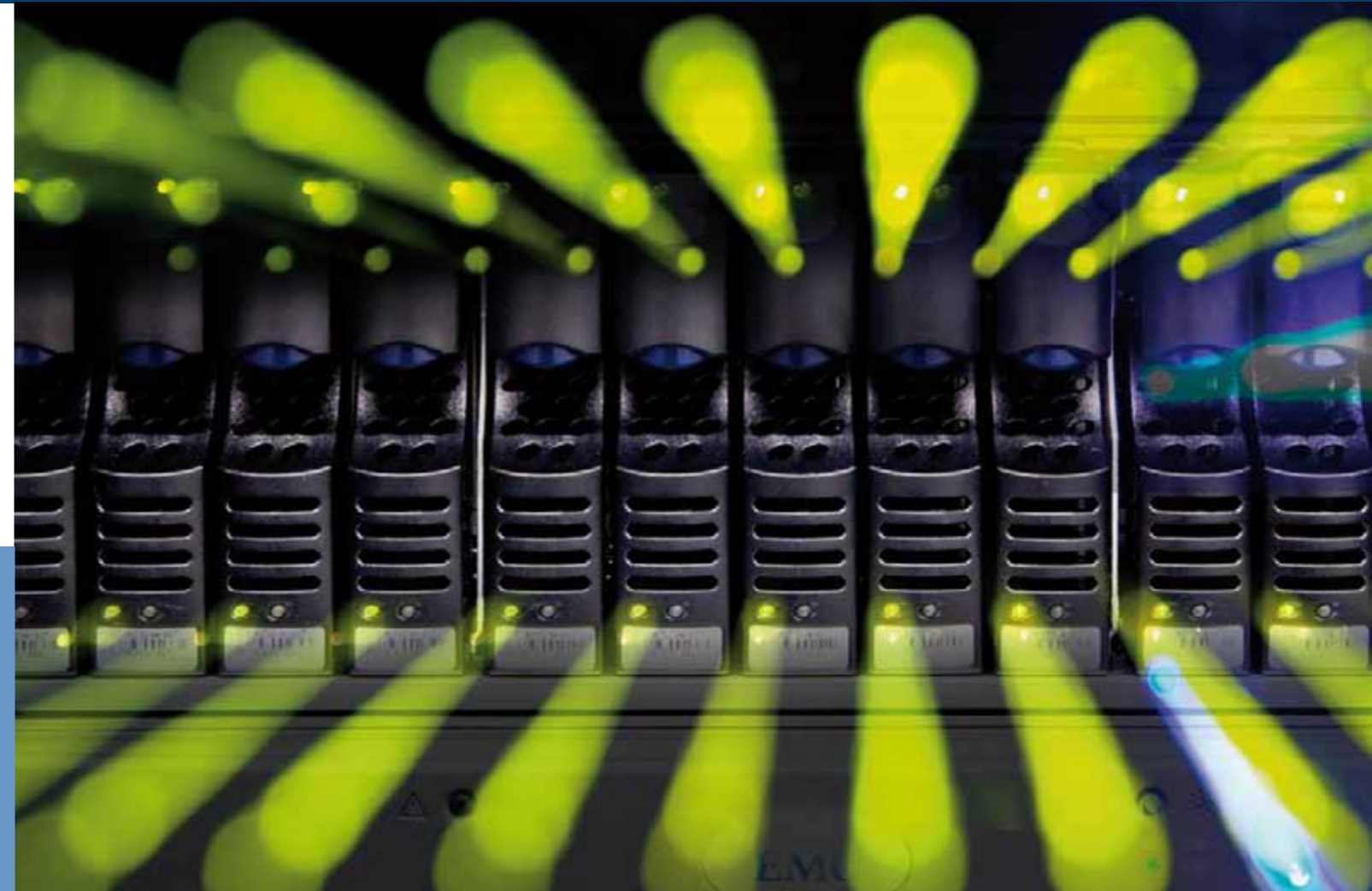
Das moderne Storage Area Network (SAN) beherbergt heute die Patienten- und Verwaltungsdaten.

„Die richtige Diagnose bildet die Basis jeder erfolgreichen Behandlung.“